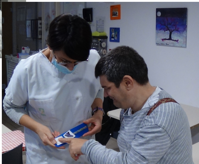
La demande et l'oralisation