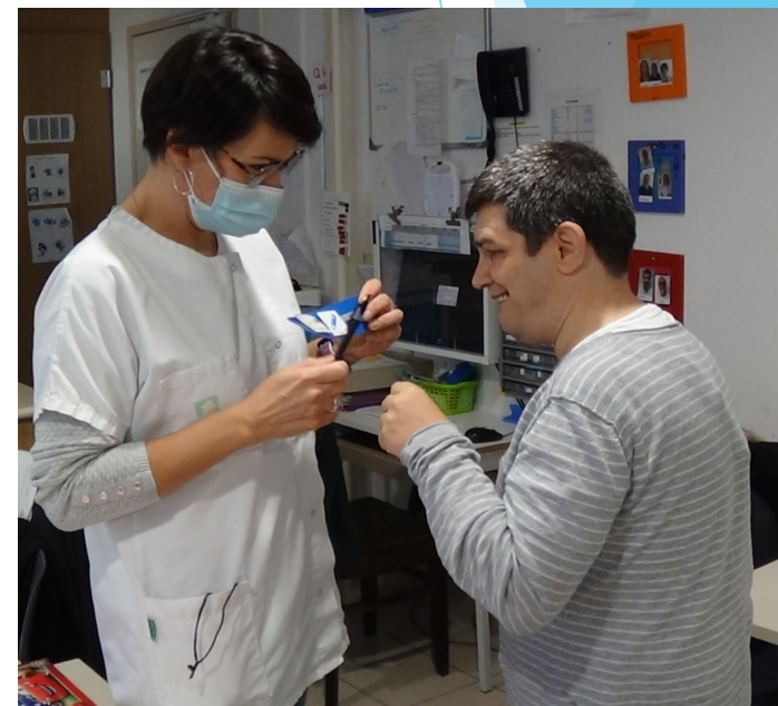
L'obtention de l'objet